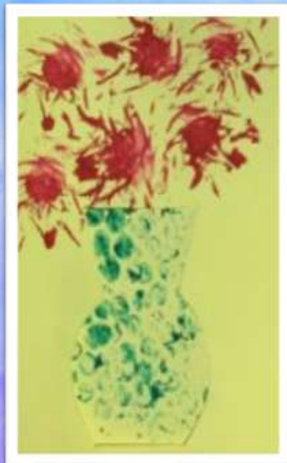
«Букет любимой маме»